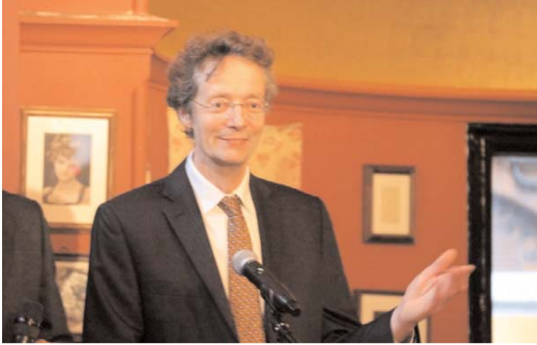
Əvvəli Səh. 5

Məhz bu əsərin ərəsəyə gəlməsindən sonra Bakıda bir tərəfdən elmi əsərlər, digər tərəfdən çoxlu dərslilər çap edilməyə başlanıb. Bu isə Nizaminin yenidən dərk edilməsinə, ona lazımi qiymətin verilməsinə səbəb olub. Düşünürəm ki, kitabın başqa bir maraqlı cəhəti var və - bəlkə də Bertels bu haqda heç düşünməyib, - bu, ondan ibarətdir ki, kitabın adı “Böyük Azərbaycan şairi Nizami” sonradan İran alimlərinin arasında bu günə qədər də davam edən bir müzakirəyə, qarşıdurma gətirib çıxarıb. Məhz buna görə kitabın ingilisdillli auditoriya üçün hazırlanmasında məqsədlərdən biri də ondan ibarətdir ki, kitabı oxuyanlar buradakı fikirlərin milliyətçilikdən irəli gəlmədiyini dərk edəcəklər. Bu, çox gözəl, sadə, eyni zamanda, asanlıqla oxunan və böyük şəxsiyyət haqqında dürüst məlumatları geniş auditoriyaya çatdıran bir kitabdır. Mən inanıram ki, bu kitabdən sonra rusdillli auditoriyada olduğu kimi, ingilisdillli auditoriyada da Nizaminin pərəstişkarları artacaqdır. Mənim böyük iftixar hissi ilə yazdığım ön sözdə qeyd edilir ki, kitab yaradılan zaman həmin konsept də nəzərdən qaçmır. Bu kitabın konsepti Qərb oxucuları üçün də əhəmiyyətli. Kitabın yarandığı dövr, 1930-cu illərin sonu heç də parlaq dövrlərdən deyildir. Stalinin repressiyalarının pik nöqtəsi olan dövr idi. Azərbaycanda da Mir Cəfər Bağırovun respublikaya rəhbərlik etdiyi həmin dövrdə repressiya qurbanlarının sayı heç də az olmayıb.