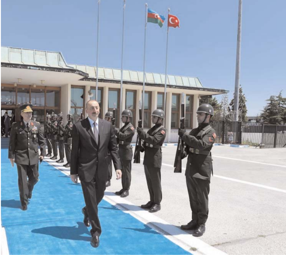
Əvvəli Səh. 5

Prezident İlham Əliyev İstanbulda keçirilən 22-ci Dünya Neft Konqresində iştirak edib