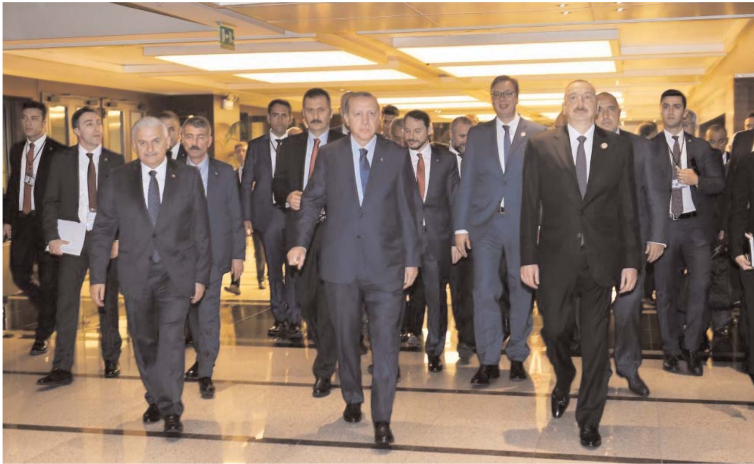
Əvvəli Səh. 3

Prezident İlham Əliyev İstanbulda keçirilən 22-ci Dünya Neft Konqresində iştirak edib