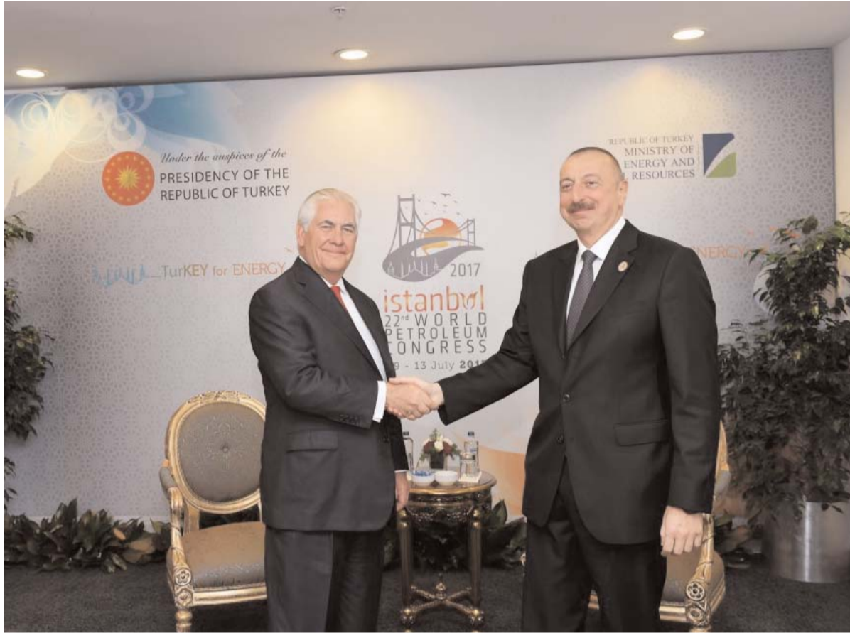
Əvvəli Səh. 2

Prezident İlham Əliyev İstanbulda keçirilən 22-ci Dünya Neft Konqresində iştirak edib