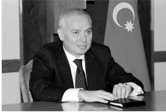
Fərhad Abdullayev Azərbaycan Respublikası Konstitusiyaya Məhkəməsinin sədri

Konstitusiyaya, həmçinin dövlət quruluşunun əsaslarını, şəxsiyyət, cəmiyyət və dövlət arasındakı münasibətlərin hüquqi çərçivələrini, siyasi sistemin təşkil prinsiplərini, hakimiyyətlərin bölünməsinə, hakimiyyət orqanlarının səlahiyyətlərini və fəaliyyət qaydalarını müəyyənləşdirir. Konstitusiyaya həm də cəmiyyət həyatının müxtəlif sahələrinə dövlətin müdaxiləsinin