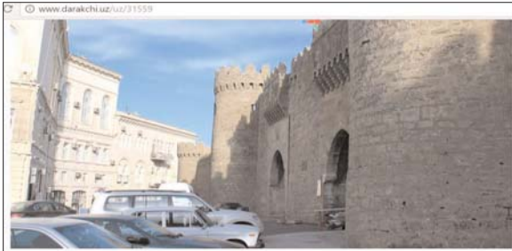
"...Якшанба куни Бокунга чиддик. Шаҳарини рус ва муслиман қисмидаги дўконлар, катта қорхона ва мағазалари, матбуалари татамман очук, чунки, муслимлар жумга куни дўкон ва қорхоналарини беркитиб, иди қилар эканларим. Бул жай ибрат ва тақсидур. Бокунги кўрғонимга үн беш сана бўлур. Ондан бери хийла юсуьат топиб, имаратлари беш-алти табақаларга юксалибдур. Денгиз канарида янги беш табақалик катта бир имарта бар экан..."

Müəllif İçərişəhərlə Özbəkistanın qədim Xivə şəhərindəki İçan Kalanı müqayisə edir. Bildirilir ki, qədimdə hər iki məkan eyni məqsədə xidmət edib, hazırda həm İçərişəhərdə, həm də İçan Kalada insanlar yaşayır. Vurğulanır ki, müasir Bakı Şərqi və Qərbi mədəniyyətini, memarlıq üslubunu özündə cəmləşdirən bir meqapolisdir. Məqalə qəzetin saytında da yerləşdirilib.