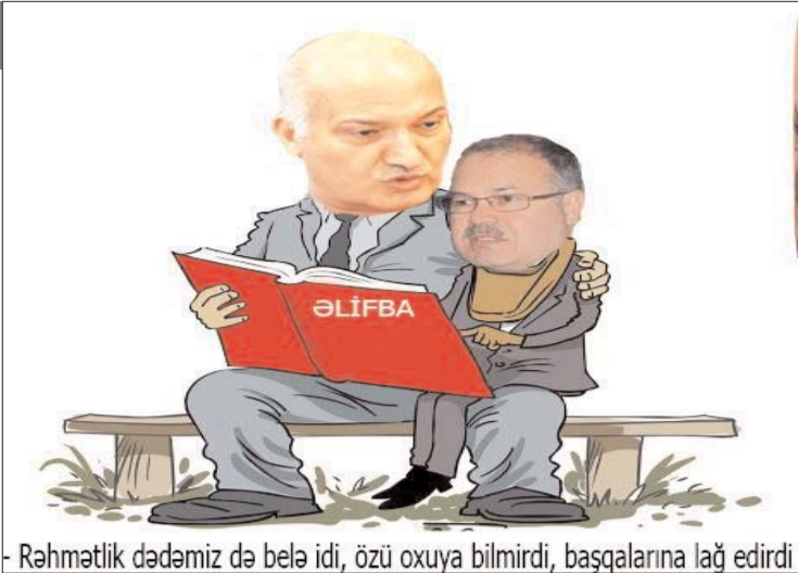
- Rəhmətlik dedəməz də belə idi, özü oxuya bilmirdi, başqalarına lağ edirdi