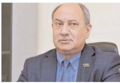
Vəhdət partiyasının sədri, millət vəkili Tahir Kərimli: “AXCP kimi partiyalar maşa rolunu oynayır”

- Dövlət Təhlükəsizlik Xidmətinin keçirdiyi antiterror əməliyyatı çox ciddi bir məsələdir. Nəyə görə? Biz görürük ki, son dövrlər Azərbaycana qarşı xaricdən edilən təsirlər var. Belə hadisələrin baş verməsi ilə həm xaricdən, həm də daxildən Azərbaycanın sabitliyini pozmaq istəyirlər. Həmin qrupları bu və ya digər formada maliyyələşdirən dairələr tapılıb üzə çıxarılmalıdır. Ancaq nə etmələrdən asılı olmayaraq, onlar heç vaxt Azərbaycanı sabitliyini poza bilməzlər. Ümu-