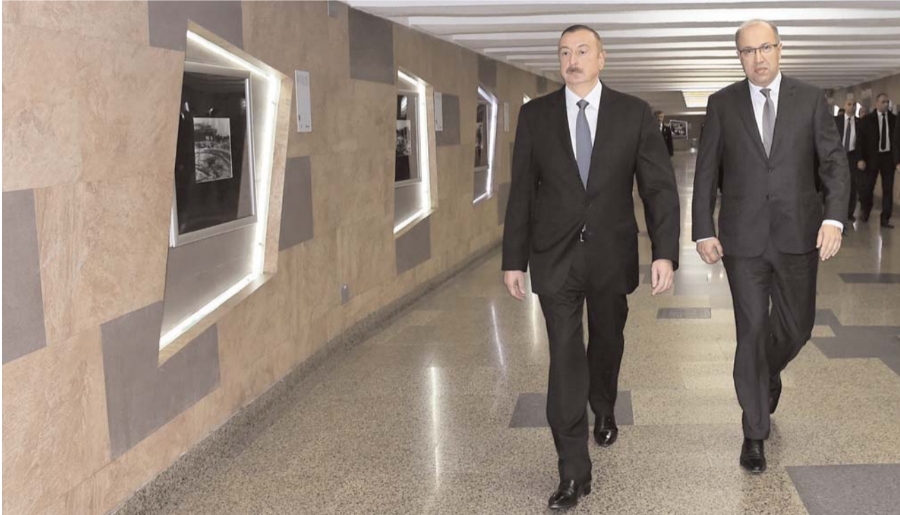
Əvvəli Səh. 2

Qeyd edək ki, 2003-cü ildə Bakı Metropoliteni yeni inkişaf mərhələsinə qədəm qoyub. 50 illik yubileyi qeyd edilən Bakı Metropoliteninin hazırda 25 stansiyası, 1 elektrik deposu və 36,6 kilometr uzunluğunda 3 xətti var. "Bakı Metropoliteni Xətlərinin Konseptual İnkişaf Sxemi" nə əsasən gələcəkdə metropolitenin ümumi şəbəkəsi 3 mövcud - Yaşıl, Qırmızı və Bənövşəyi, həmçinin 2 əlavə yeni xətt - Mavi və Sarı xətlər olmaqla 5 xətdən, 76 stansiyadan, 6 elektrik deposundan və 119,1 kilometr metro xəttindən ibarət olacaq. Perspektivdə 51 yeni stansiyanın inşa edilməsi və 84,3 kilometr uzunluğunda metro xəttinin çəkilməsi nəzərdə tutulub.