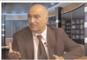
Müsaibimiz Vəhdət partiyasının sədri, millət vəkilii Tahir Kərimlidir

toplantılarının keçirilməsinə daha çox Polşanın Azərbaycandakı səfirliyi az qala koordinasiyaçı rolunda çıxış edir. Bunun üçün dəfələrlə müxalifət liderlərinin iştirakı ilə səfirlikdə görüşlər də keçirilib. Polşanın bu məsələdə marağı nə ola bilər?