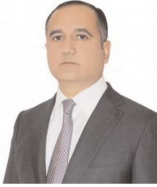
Kamaləddin QAFAROV, Azərbaycan Respublikası Milli Məclisinin deputatı