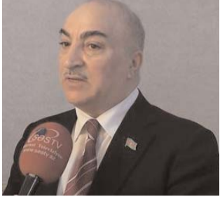
Müsaibimiz Vəhdət partiyasının sədri, millət vəkili Tahir Kərimlidir

- Tahir bəy, sizcə, nəyə görə Azərbaycan sərhədini keçən kimi dağıdıcı müxalifət partiyaya sədrləri ölkəmiz əleyhinə əks-təbliğət kampaniyası aparırlar?