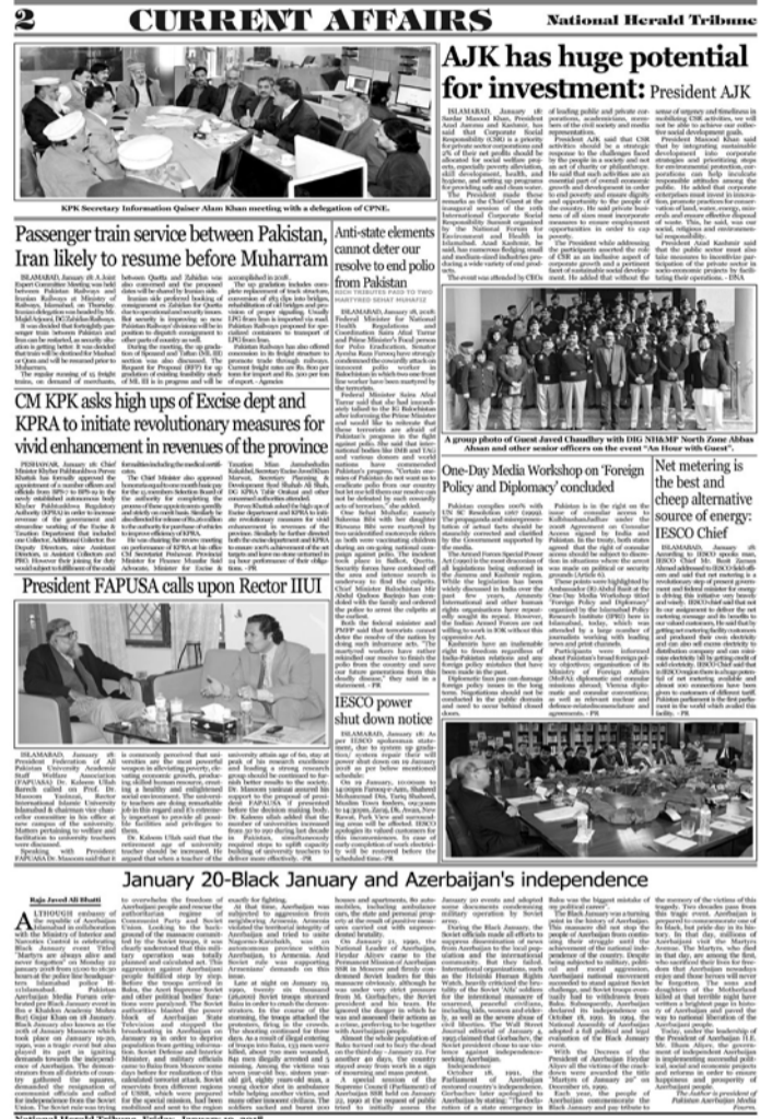
National Herald Tribune, Friday, January 19, 2018

Məqalədə 1990-cı il yanvarın 22-də bir milyonun çox insanın şəhidləri dəfn etmək üçün küçələrə çıxdığı və bundan sonra Azərbaycanda 40 günlük matəm elan olduğu diqqətə çatdırılır və bunun Azərbaycan neftindən asılı olan Sovet iqtisadiyyatına ciddi zərər yetirdiyi bildirilir. Həmçinin hadi-