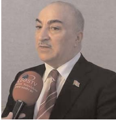
Müsaibimiz Vəhdət partiyasının sədri, millət vəkilisi Tahir Kərimlidir

- 20 Yanvar elə bir gündür ki, həmin gün iqtidar-müxalifət fərqi olmalı deyil. Şəhidlər Xiyabanında yatan şəhidlərimizin müqəddəs ruhu qarşısında hər kəs susmalıdır, əsasən də, müxalifət düşərgəsini təmsil edən şəxslər. Yəni 20 Yanvar faciəsinin ildönümü günündən müxalifət partiya sədrləri öz məqsədləri üçün istifadə etməməlidirlər. Bir sözlə, 20 Yanvar faciəsinin ildönümü günü Şəhidlər Xiyabanına şəhidlərimizi ziyarətə gə-