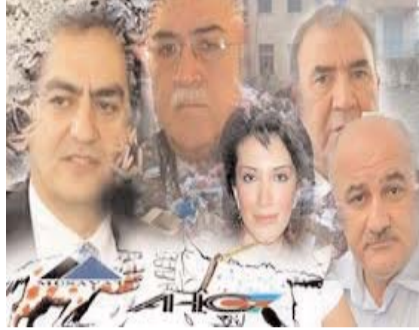
yüz adam təşkil edir

Mövzu aksiyalara gəlib çatanda sübut olundu ki, dağıdıcı müxalifətin sıralarını ayrı-ayrılıqda bir neçə