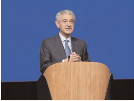
Əvvəli Səh. 4

Yeni Azərbaycan Partiyasının Qurultayında partiyanın Sədri İlham Əliyevin prezident seçkilərində namizədliyi irəli sürülüb