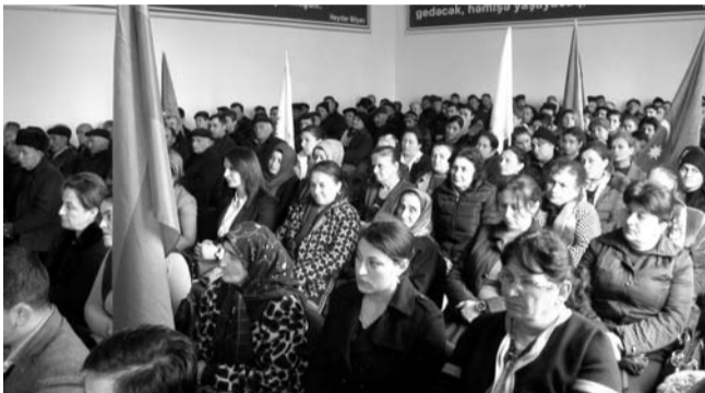
Əvvəli Səh. 9

Seçicilər günü-gündən dəyişən Azərbaycanın işıqlı sabahı naminə Cənab İlham Əliyevə səs verəcəklərini bildiriblər.