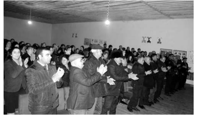
Görüşlərdə çıxış edən kənd sakinləri ağdamlı seçicilərin aprelin 11-də YAP-ın namizədi Cənab İlham Əliyevə səs verəcəklərini bildiriblər.