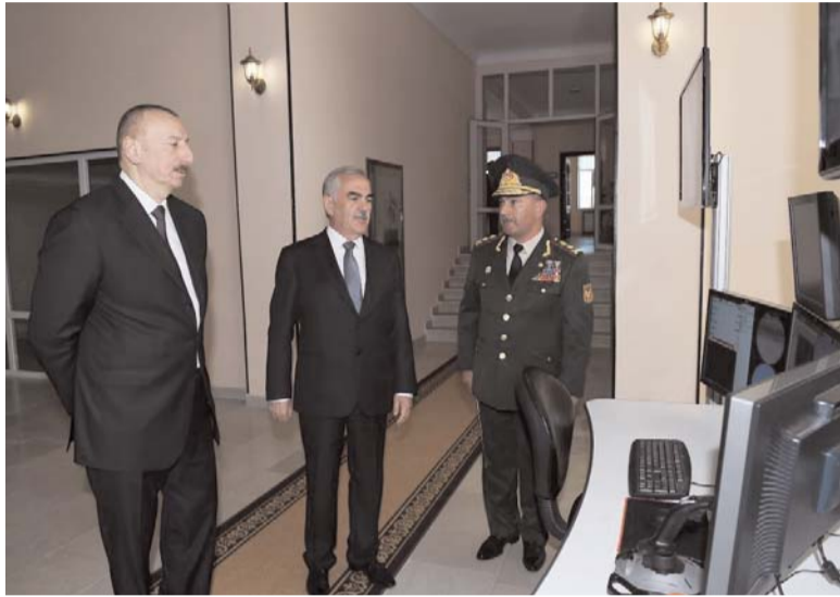
Əvvəli Səh. 2

İlham Əliyev: "Naxçıvan Muxtar Respublikası bütün iqtisadi göstəricilərinə görə çox sürətlə inkişaf edən respublikadır"