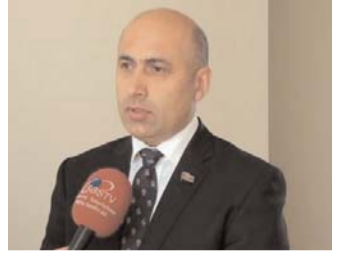
Müsaibimiz millət vəkili Azər Badamovdur

Azər Badamov: "Torpaqlarımızın işğaldan azad olunması hərbi güc vasitəsilə təmin edilməlidir"