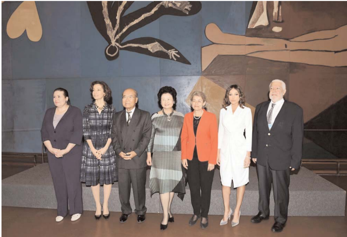
Azərbaycanın Birinci vitse-prezidenti, UNESCO-nun xoşməramlı səfiri Mehriban Əliyeva konfransda iştirak edib

Azərbaycan-UNESCO münasibətlərinin inkişafında Birinci vitse-