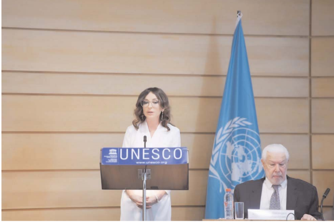
Azərbaycanın Birinci vitse-prezidenti, UNESCO-nun xoşməramlı səfiri Mehriban Əliyeva konfransda iştirak edib

İnsan potensialının inkişafı UNESCO-nun və Azərbaycanın böyük əhəmiyyət verdiyi digər sahədir. Keyfiyyətli təhsil və mədəniyyət insan inkişafı üçün əsas