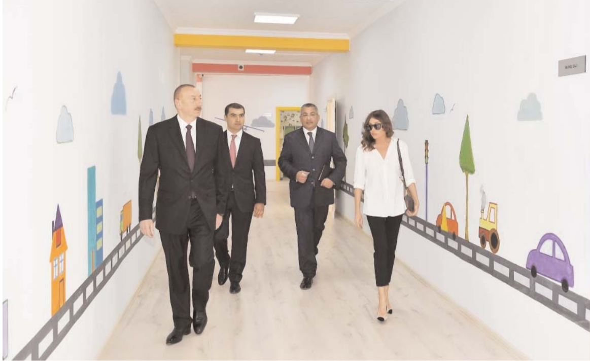
Əvvəli Səh. 2

Bağçanın yerləşdiyi ərazidə genişmiqyaslı abadlıq-quruculuq işləri görüldü, müxtəlif çiçək və gül kolları, ağaclar ekilib. Ətrafda abadlıq və quruculuq işləri görüldü.