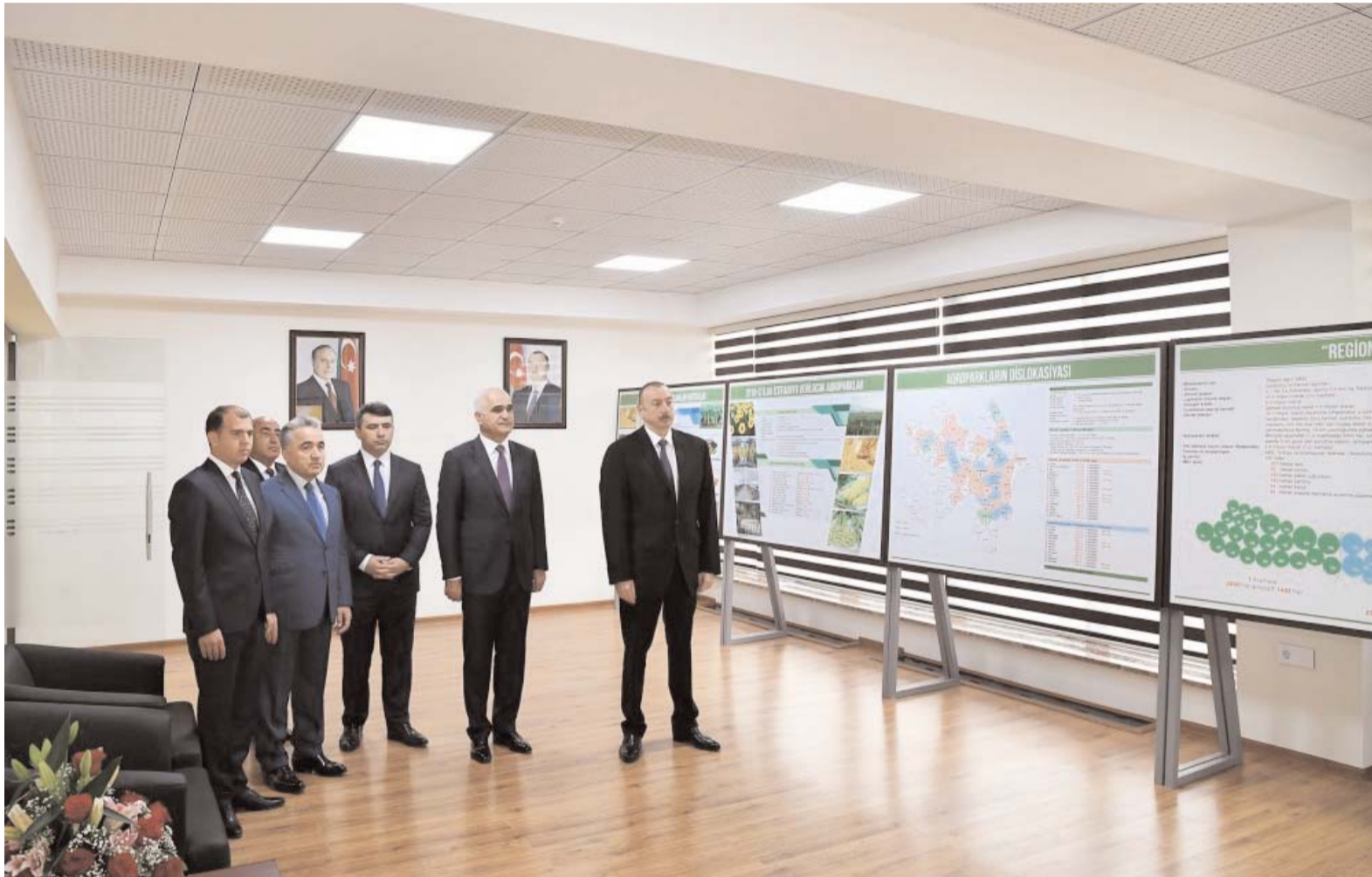
Əvvəli Səh. 2

Prezident İlham Əliyev Goranboy və Naftalan rayonlarına səfər edib