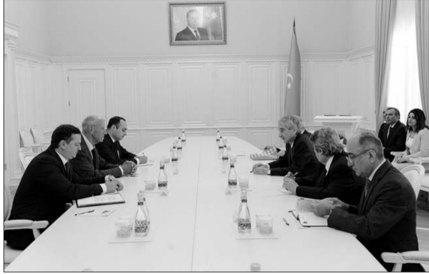
sis Qarri ölkəmizin Ümumdünya Əqli Mülkiyyət Təşkilatının reallaşdırdığı layihələrə göstərdiyi dəstəyi yüksək dəyərləndirib. Qonaq əməkdaşlığın bundan sonra da inkişafının əhəmiyyətini vurğulayıb.

Azərbaycana səfərindən məmnunluğunu ifadə edən baş direktor Fren-