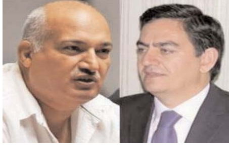
yətinin maraqlarının müdafiəsi üzərində qurulub”.

yasiləşmiş QHT təmsilçilərinin mövqelərini kəskin şəkildə tənqid edir. Q.İbadoğlu X.İsmayılı yalançı müxalif, saxta vətənpərvər adlandırır: “Siz ey Vətən, millət, dövlət anlayışlarına gizli nifrətini zaman-zaman bürüzə verən, ələcsiz qalanda son çarə kimi “Çamur at, izi qalsın” prinsipi ilə mövcudluğunu sürdüren prinsipsizlər - yalançı müxaliflər, saxta vətənpərvərlər! Qulaqlarınızı açın və eşidin: mən təmsil olduğum istənilən beynəlxalq və yerli platformada əsaslandırılmış müstəqil mövqedən çıxış edərəm, mövqeyim həmişə Azərbaycan dövlətinin və müstəqil vətəndaş cəmiyyə-