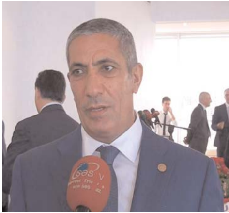
görür. Mən kollektivə uğurlar arzulayıram və təbrik edirəm".

YAP İcra katibinin müavininin sözlərinə görə, "Səs" İnformasiya Agentliyi qısa müddətdə fəaliyyətə başlasa da, çox böyük tarixi var: "Agentlik "Səs" qəzetinin bazasında formalaşan bir media qurumudur. Amma bununla yanaşı özündə müasirliyi, inkişafı, tərəqqini əks etdirib. "Səs" İnformasiya Agentliyi ölkəmizin hər bir yerindən, hər bir sahəsindən mütəmadi olaraq Azərbaycan ictimaiyyətini informasiya ilə təmin edir. Bir sözlə, Agentlik az sayda kollektivlə çox böyük işlər