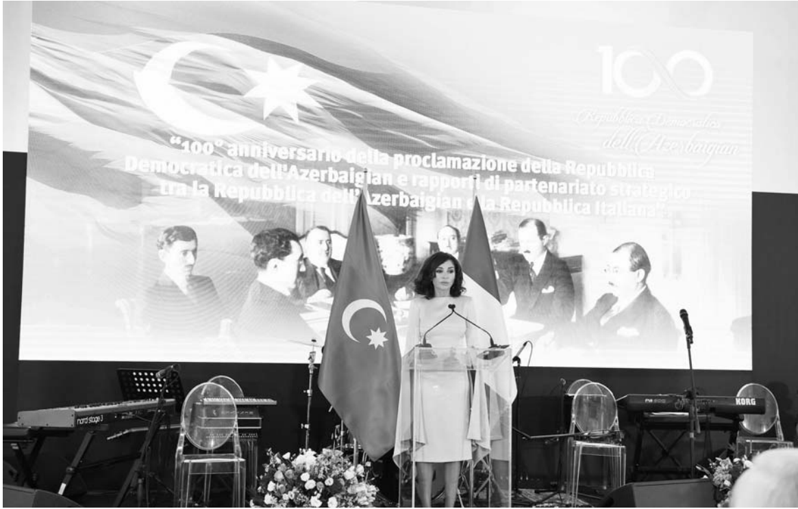
ninmasının təsadüfi olmadığını, Azərbaycanda millətlərarası dialo-

Birinci vitse-prezident qonaqları salamlayaraq, Azərbaycan Xalq Cümhuriyyətinin yaranma tarixinə nəzər saldı. Diqqətə çatdırdı ki, həmin dövrdə ölkəmiz üçün çox vacib addımlar atıldı: Azərbaycanda demokratiya institutları formalaşmağa başladı, azad seçkilər nəticəsində çoxmilli və çoxpartiyalı parlament yaradıldı, ölkəmiz üçün bir sıra vacib qanunlar qəbul edil-