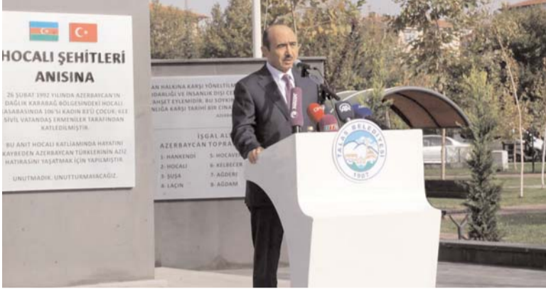
Əvvəli Səh. 6