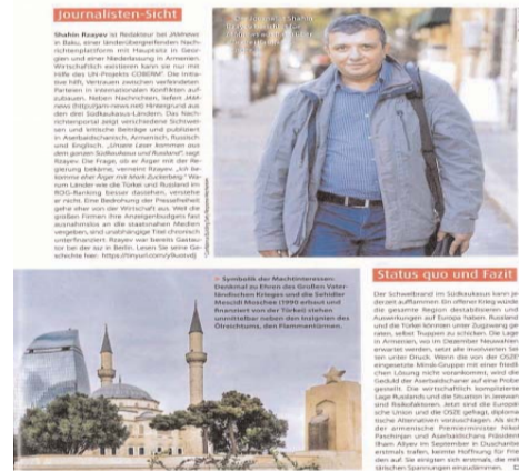
Journalisten-Sicht: Ein Foto zeigt einen Mann in einem blauen Mantel, der als Journalist identifiziert wird.

Məqalədə bildirilir ki, BMT Nizamnaməsinin ikinci maddəsinin dördüncü bəndi əsas götürülərək münaqişə ilə bağlı 1993-cü ildə qəbul edilmiş qətnamələrə məhəl qoyulmur və bu vəziyyət 27 ildən çoxdur ki, davam edir. Ermənistan silahlı qüvvələri Azərbaycan ərazilərini işğal atlında saxlamasına baxmayaraq, Yerevan Azərbaycanı Dağlıq Qarabağdakı erməni əhalisinə hücum etməkdə ittiham edir. Hətta Ermənistanın sabiq prezidenti Serj Sarkisyan 2016-cı ildə Berlində səfəri zamanı bu məsələyə primitiv cavab da vermişdi. O, ermənilərin Dağlıq