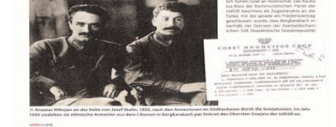
Ein Foto zeigt zwei Männer in einer Diskussion, die im Zusammenhang mit dem Konflikt stehen.

Armenien hat im Laufe des Krieges 20 Prozent des Territoriums von Aserbaidschan besetzt und diskutiert sein Handeln als „Selbstverteidigung“. 1988 eskalirte sich die Auseinandersetzung zwischen Armenien und Aserbaidschan zu einem bewaffneten Konflikt. Die Streitkräfte beider Länder griffen zu militärischen Maßnahmen, um die Kontrolle über das Gebiet zu sichern. In der Folgezeit kam es zu zahlreichen Todesfällen und Verwundungen. Die internationale Gemeinschaft forderte die Parteien auf, den Konflikt friedlich zu lösen. Dennoch setzte sich die Gewalt fort, bis 1994 ein Waffenstillstand vereinbart wurde. Seitdem kontrolliert Armenien ein Teil des Territoriums, das von Aserbaidschan beansprucht wird. Die Streitkräfte beider Länder sind weiterhin präsent, was die Situation angespannt hält.