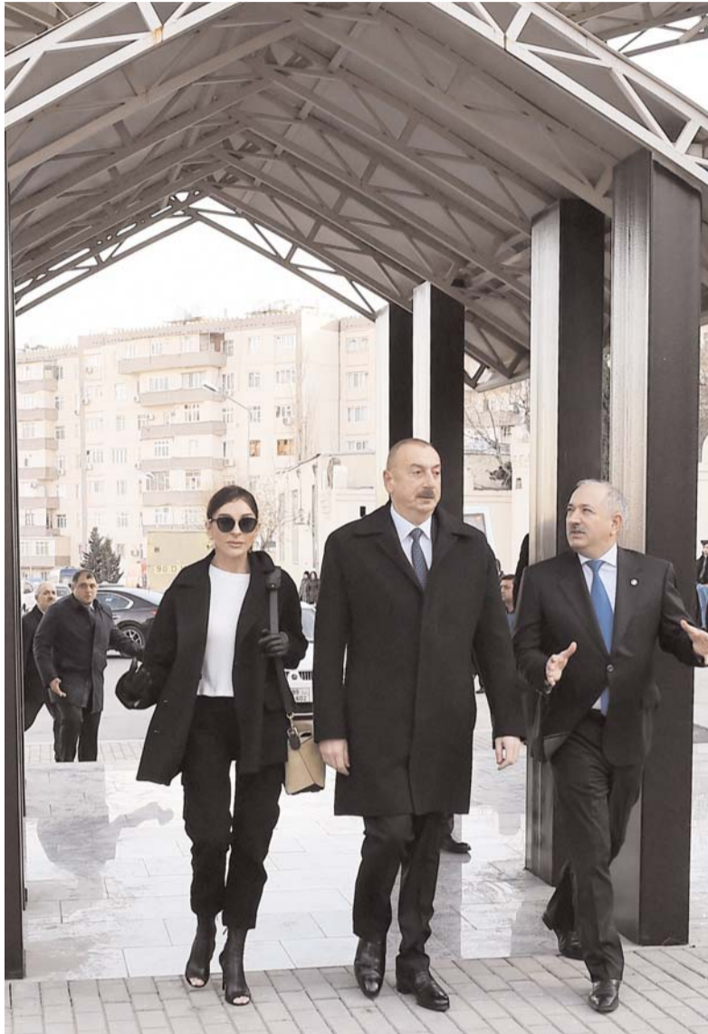
şələrinin yaradılması, əhaliyə xidmət göstərən müasir infrastrukturun qurulması paytaxtımızı dünyanın ən gözəl şəhərlərindən birinə

Prezident İlham Əliyevin tapşırığı ilə son dövrlərdə Bakı şəhərində parklar və xiyabanlar əsaslı şəkildə yenidən qurulur, yeni park, xiyaban və istirahət guşələri yaradılır. Bütün bunlar sakinlərin və şəhərimizə gələn qonaqların rahatlığı üçün müasir istirahət guşələrinin yaradılması istiqamətində reallaşdırılan layihələrin davamıdır. Yeni park, istirahət məkanı və gu-