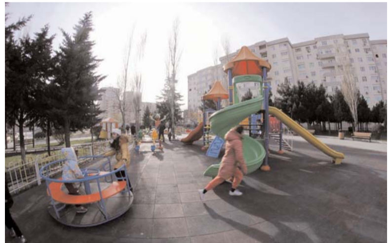
Yeni park və xiyabanların salınması ölkəmizdə aparılan geniş abad- və yüksək keyfiyyətlə davam etdirilir.