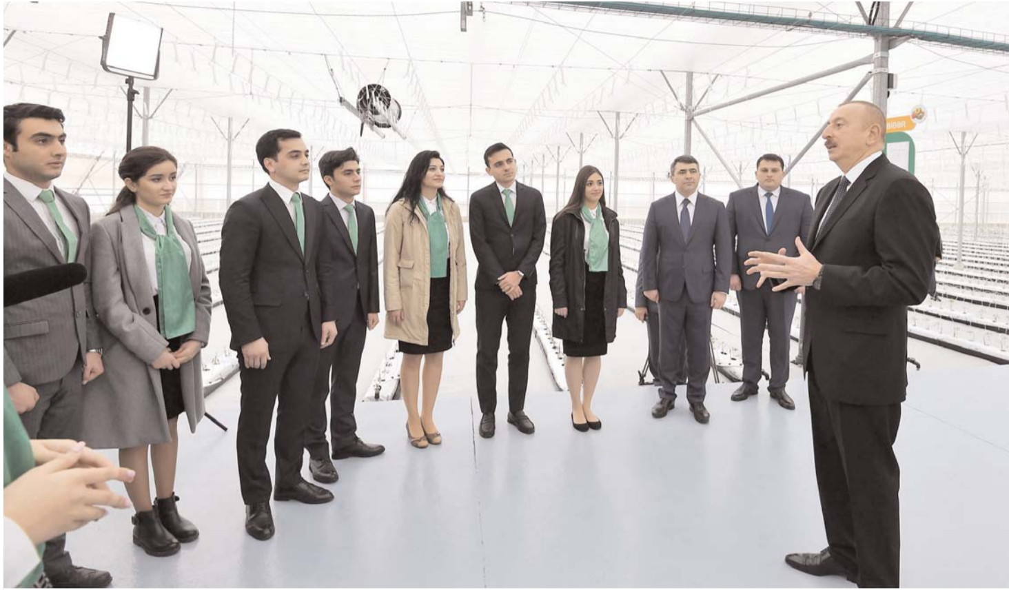
Əvvəli Səh. 2

Prezident İlham Əliyev Tərəvəzçilik Elmi-Tədqiqat İnstitutunun açılışında iştirak edib