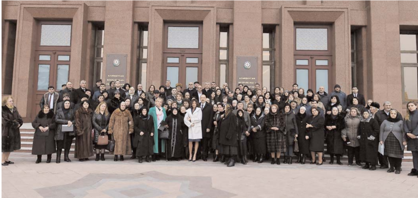
Əvvəli Səh. 4

Azərbaycan Prezidenti İlham Əliyev şəhid ailələri ilə görüşüb