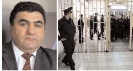
kimiyyətinə bənzədiyini yazıb.