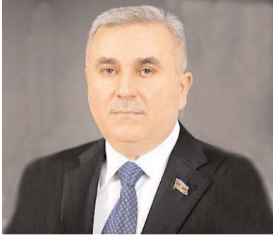
NƏRİMAN ƏLİYEV, Milli Məclisin deputatı

Təsədüfi deyildir ki, bu gün dünyada kəskinləşən böhran əksər ölkələrdə bir sıra sosial proqramların tətbiqə salınması ilə müşahidə olunduğu halda, Azərbaycan Prezidenti ölkəmizdə bütün sosial proqramların uğurla davam etdirilməsini mühüm vəzifələrdən biri kimi qarşıya qoyub. Əhəlinin, xüsusən də, aztəminatlı təbəqənin alıcılıq qabiliyyətinin artırılması, milli valyutanın devalvasiyasının və qiymət artımının təsirlərinin azaldılması məqsədi ilə müxtəlif sosial ödənişlərin, o cümlədən, əmək haqlarının, pensiyaların, müavinətlərin, təqaüdlərin və kompensasiyaların artırılması məsələsinə mühüm önəm verilir. Prezident İlham Əliyev