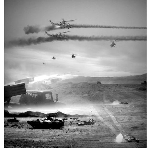
kən igid əsgər və zabıtları vardır və işğalçı Ermənistan qeyri-konstruktiv mövqeyindən əl çəkərək, Azərbaycan torpaqlarını qeyd-şərtsiz azad etməlidir, əks-təqdirdə təcavüzkar Ermənistan qarşısında qüdrətli Azərbaycan Ordusunun gücünü bir daha görəcəklər!

Bəli, bu gün Azərbaycan xalqı xoşbəxtdir ki, onun Cənab İlham Əliyev kimi lider Prezidenti, Ali Baş Komandanı var. Həmçinin, əlində silah gecə-gündüz Vətəne keşik çə-