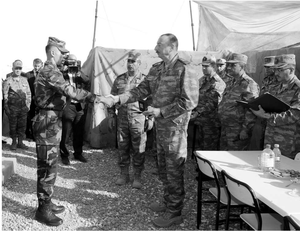
Azərbaycanın dövlət bayrağı bu gün hələ də işğal altında olan bütün torpaqlarda qaldırılacaqdır".

1994-cü ildə atəşkəsin elan edilməsindən sonra cəbhə xəttindəki ən böyük qarşıdurma 2016-cı ilin aprelinə təsadüf edir. Ermənistan silahlı qüvvələrinin növbəti təcizbatına Azərbaycan Ordusu əks-hücumla cavab verməyə məcbur oldu. Prezident İlham Əliyev Bakı şəhərinin işğaldan azad edilməsinin 100 illiyinə həsr olunmuş paradın çıxışında Azərbaycan Ordusu döyüş meydanında öz gücünü və məharətini göstərdiyini xətrilətdi. "Bu gün Azadlıq meydanına döyüşlərdə olmuş Azərbaycan bayraqları gətiriləcək. O bayraqlar ki, 2016-cı ildə Ağdərə, Füzuli və Cəbrayıl rayonlarının işğaldan azad edilmiş torpaqlarında Azərbaycan əsgəri tərəfindən qaldırılmışdır. O bayraqlar ki, bu ilin may ayında Azərbaycan-Ermənistan sərhədinin Naxçıvan hissəsində uğurlu əməliyyat nəticəsində, işğaldan azad edilmiş torpaqlarda qaldırılmışdır. Gün gələcək