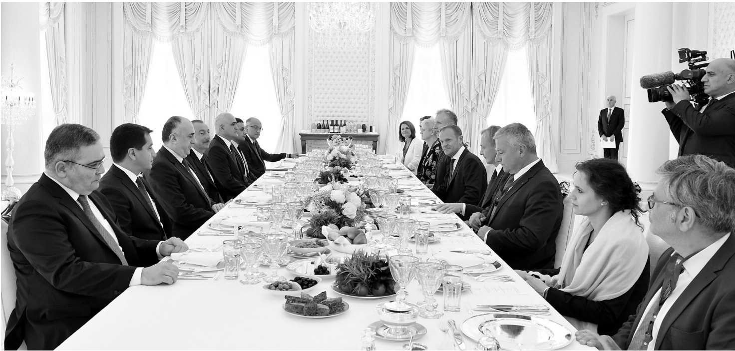
Əvvəli Səh. 2

Azərbaycan Prezidenti İlham Əliyevin və Avropa İttifaqı Şurasının Prezidenti Donald Tuskun görüşü olub