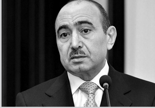
Əli HƏSƏNOV, Azərbaycan Prezidentinin ictimai-siyasi məsələlər üzrə köməkçisi

H ər bir dövlətin idarəçilik sisteminin effektivliyi, ilk növbədə mövcud hakimiyyətin qəbul etdiyi qərarların düzgünlüyündən və ölkənin strateji maraqlarına cavab verməsindən asılıdır. Səmərəli idarəçilik, həmçinin qəbul olunmuş qərarları icra edəcək kadrların peşəkarlığı ilə də sıx bağlıdır. Əgər düzgün siyasət iqtidarın uzaqgörənliyi, pragmatizmi, qətiyyəti, prinsipliliyi və təmkinli davranışı ilə şərtlənirsə, kadr siyasətinin uğuru qəbul olunmuş qərarların vaxtında və tam yerinə yetirilməsindən, o cümlədən qarşıya qoyulan vəzifələrin, ortaya çıxan ictimai problemlərin həllində optimallıq, operativlik və icra intizamından asılıdır.