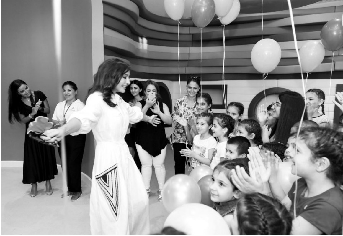
Əvvəli Səh. 4

İkimərtəbəli məktəbəqədər təhsil müəssisəsinin otaqları və dəhlizləri uşaqların sevimli nağıl qəhrəmanlarının şəkilləri ilə bəzədilib, qrup otaqları zəruri inventarlarla, mebel dəstləri ilə təchiz edilib. Məktəbəqədər təhsil müəssisəsində yeddisi Azərbaycan, dördü isə rusdilli bölmə olmaqla, ümumilikdə, 11 qrup fəaliyyət göstərəcək. Körpələr evi-uşaq bağçasında 2 yaşdan 6 yaşadək uşaqların təlim-təربiyəsi ilə 42 nəfərdən ibarət peşəkar heyət məşğul olacaq. Bağçanın ərazisində abadlıq işləri görüldü, yaşıllıqlar salınıb, işıqlandırma sistemi quraşdırılıb. Burada balacaların istirahəti üçün oyun və idman avadanlıqları da var. Bir sözlə, bu müəssisədə uşaqların