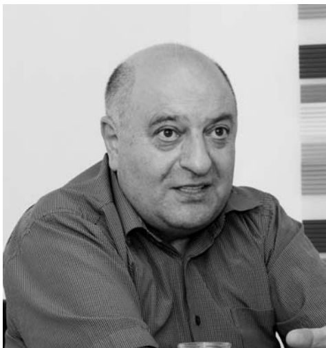
Musa Urud, Millət vəkili, YAP Siyasi Şurasının üzvü.

bir cüt "keta" alıb gətirdi və bu keta futbol oyununda mənə yüksək üstünlük və hörmət qazandı. Doğrudan da, qaloşla, rezin çəkmə ilə, sandaletlə, hətta ayaqyalın kəndimizin daşlı küçələrində top qovalamaqdan doymayan biz kənd uşaqları üçün bu yüngül, rahat və möhkəm keta ilə futbol oynamaq ayrı zövq və imtiyaz idi. Hətta yaxın dostlarımız mənə futbola getməyən günlərdə ketanı növbə ilə geyinib, futbol oynamaq üçün evimizə minnətə də gəlirdilər. Onda biz hələ "Kitay" sözünü eşitməmişdik və ketanın üstündə rusca "Sdelano v Kitay" sözünü elə keta kimi başa düşürdük.