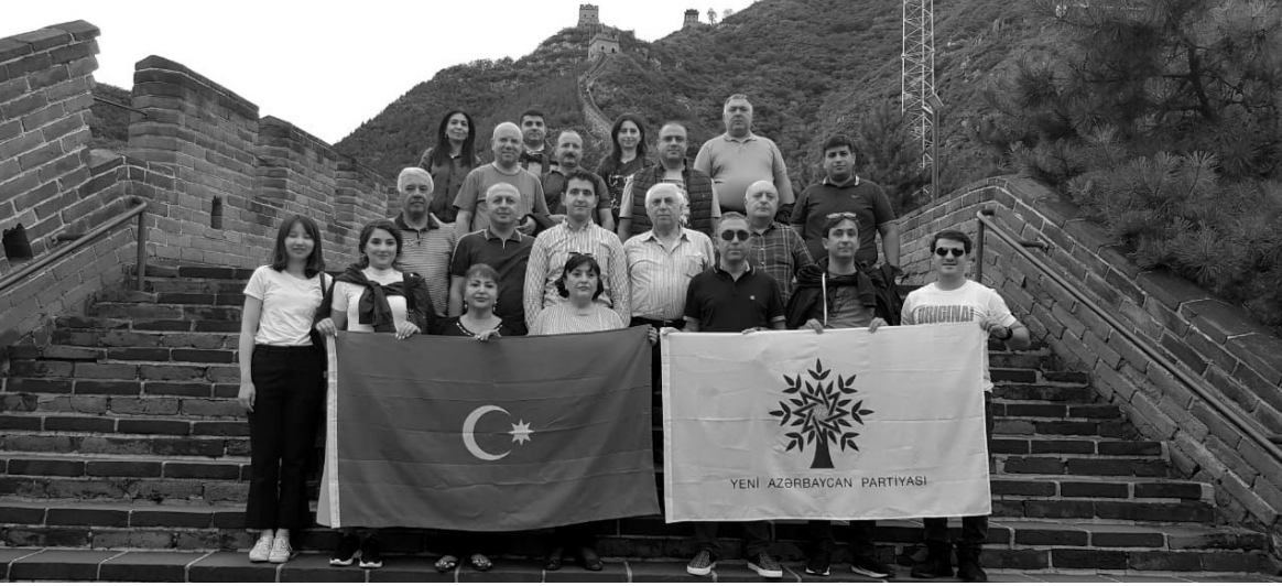
Əvvəl Səh. 11