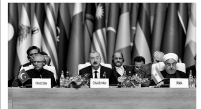
El presidente de Azerbaiyán, İlham Əliyev, entre los presidentes de Pakistán, Arif Alvi, ایران, Hasan Rohani

Los No Alineados reiteran el respeto a la integridad territorial de los países