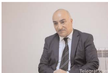
Müsahibimiz Vəhdət partiyasının sədri, millət vəkili Tahir Kərimlidir

vat başqanı Arif Hacılı Əfqan Muxtarlı və Gözəl Bayramlı kimi məsələlərdə onların hüquqlarını müdafiə etməkdənsə daha çox öz maraqlarını təmin etməyə səy göstərirlər. Bunun siyasi riyakarlıqdan başqa bir şey olmadığını demək olarmı?