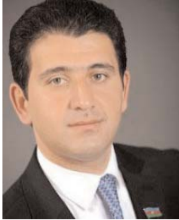
can gəncliyinə nə kimi faydası oldu?

- Bu ilk və yeganə Dövlət proqramı deyil, 2005-ci il 30 avqust tarixində əsas qoyulan 2005-2009-cu illəri əhatə edən Azərbaycan Gəncliyi dövlət proqramının Azərbaycanda