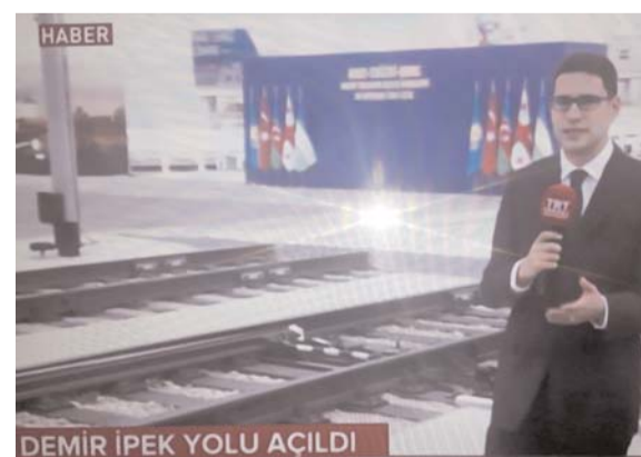
DEMİR İPEK YOLU AÇILDI

zetlərdən olan "Hürriyyət" bu barədə "Tarixi an", "Aydınlıq" "Strateji Bakı-Tbilisi-Qars dəmir yolu açıl-