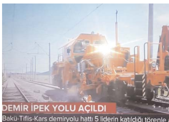
DEMİR İPEK YOLU AÇILDI Bakü-Tiflis-Kars demiryolu hattı 5 liderin katıldığı törenlə a

Anadolu Agentliyi bir gün ərzində mövzu ətrafında ondan çox məlumat yayıb. Ölkənin ən nüfuzlu qe-