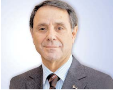
Novruz Məmmədov, Azərbaycan Prezidentinin xarici siyasət məsələləri üzrə köməkçisi

Dağlıq Qarabağın Ermənistan tərəfindən işğalına biganə yanaşan Avropa öz bu gün separatizmlə üzləşdiyindən məsələyə mövqeyini dəyişməyə, öz üzvlərinin ərazi bütövlüyünü dəstəkləyən bəyanatlar verməyə başlayıb ki, bu da ikili standartların bariz nümunəsidir. Halbuki biz dəfələrlə separatizmə qarşı vahid mövqeyin formalaşdırılmasının zərurliyini, separatizmin bumeranq effekti verərək, Avropanın özünə qayıdacağı barədə fikirlər bildirmişik. Əgər Avropa Şurası belə addımlarla Azərbaycanı qurumdan kənarlaşdırmaq niyyətini əsaslandırmağa çalışırsa, buna heç bir ehtiyac yoxdur. Azərbaycan Avropa Şurasına üzv olduğu dövrdən etibarən, Avropa