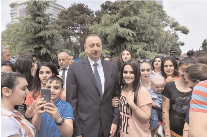
Əvvəli Səh. 2

Bu il iqtisadiyyatın qeyri-neft sektoru 2 faizdən çox, iqtisadiyyatımızın qeyri-neft sənayesi 3 faizdən çox, kənd təsərrüfatı isə 4 faizdən çox artmışdır. Hesab edirəm ki, indiki şərait üçün bu, çox yaxşı nəticədir. Əminəm ki, 2018-ci ildə rəqəmlər daha da böyük olacaq. Eyni zamanda, biz öz valyuta ehtiyatlarımızdan da çox səmərəli şəkildə istifadə etdik. Baxmayaraq ki, neftin qiyməti aşağı düşüb, biz valyuta ehtiyatlarımızı artırma bilmişik, özü də böyük dərəcədə. Valyuta ehtiyatlarımız 4,5 milyard dollardan çox artmışdır. Bu da bizim strateji ehtiyatımızdır, bizə həm iqtisadi, həm də siyasi müstəqillik verən və onu gücləndirən amillərdən biridir. Azərbaycanın regionları bu il sürətlə inkişaf etmişdir. Mən bu il regionlara 30-dan çox səfər etmişəm.