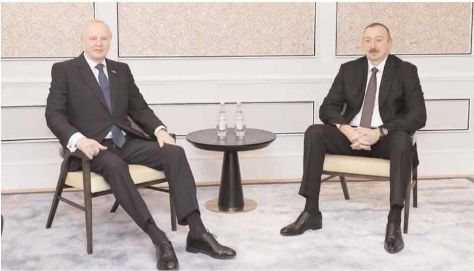
Əvvəli Səh. 2

Prezident İlham Əliyev Böyük Britaniya və Şimali İrlandiya Birləşmiş Krallığına səfər edib