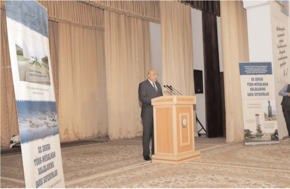
Əvvəli Səh. 5

Qusarda "XX əsrdə türk-müsəlman xalqlarına qarşı soyqırımları" mövzusunda V Beynəlxalq elmi konfrans işə başlayıb