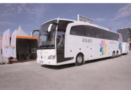
Azərbaycan Respublikasının Prezidenti yanında Vətəndaşlara

S əyyar “ASAN xidmət” mayın 1-dən 25-dək Şabran rayonunda, mayın 1-dən 30-dək Biləsuvar, Zaqatala şəhərlərində, mayın 7-dən 26-dək Ağstafa rayonunda, mayın 8-dən iyunun 6-dək Xırdalan şəhərində, mayın 10-dan iyunun 9-dək İmişli rayonunda, mayın 11-dən 25-dək Buzovna qəsəbəsində, mayın 18-dən 29-dək Samux şəhərində, mayın 18-dən iyunun 14-dək Ağcabədi şəhərində, mayın 24-dən iyunun 22-dək Salyan şəhərində vətəndaşlara xidmət göstərəcək.