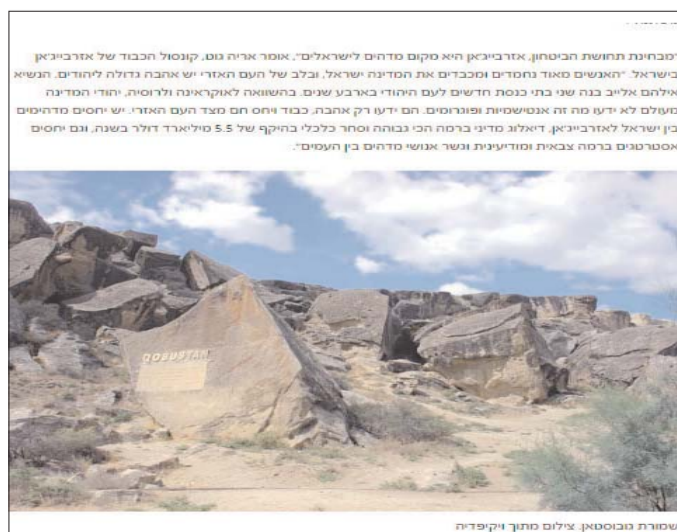
שומרת מבוססאן: צילום מתוך ויקיפדיה

yəvi respublika elan edən, qadınlara seçki hüququ verən ilk müsəlman ölkəsidir. O yazır: “1918-ci ildə yaradılan Azərbaycan Xalq Cümhuriyyəti 23 ay fəaliyyət göstərib. Azərbaycan 1991-ci ildə dövlət müstəqilliyini yenidən bərpa edib. SSRİ dağıldığı dövrdə Ermənistan və Azərbaycan arasında münasibətlər yaranıb. Nəticədə Ermənistan Azərbaycan qəzilərindən 20 faizini, o cümlədən Dağlıq Qarabağı və ətraf 7 rayonu işğal edib. Amma bu hadisə Azərbaycanın multikultural modelinə əsl təsir göstərməyib. Azərbaycan xalqı nadir humanizmi, mehribanlıqı və qonaqpərvərliyi ilə seçilir və siz bu möcüzələr ölkəsinə səfər etməklə, bütün deyilənləri sinaya və yoxlaya bilərsiniz”.