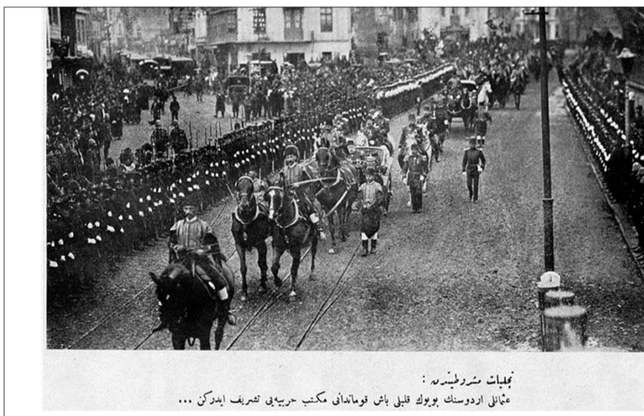
تعميرات مشروطيه: عمال اردوسنك ببولك قيلي باش قومانداني مكتب حربي في تشریف ايدركن ...