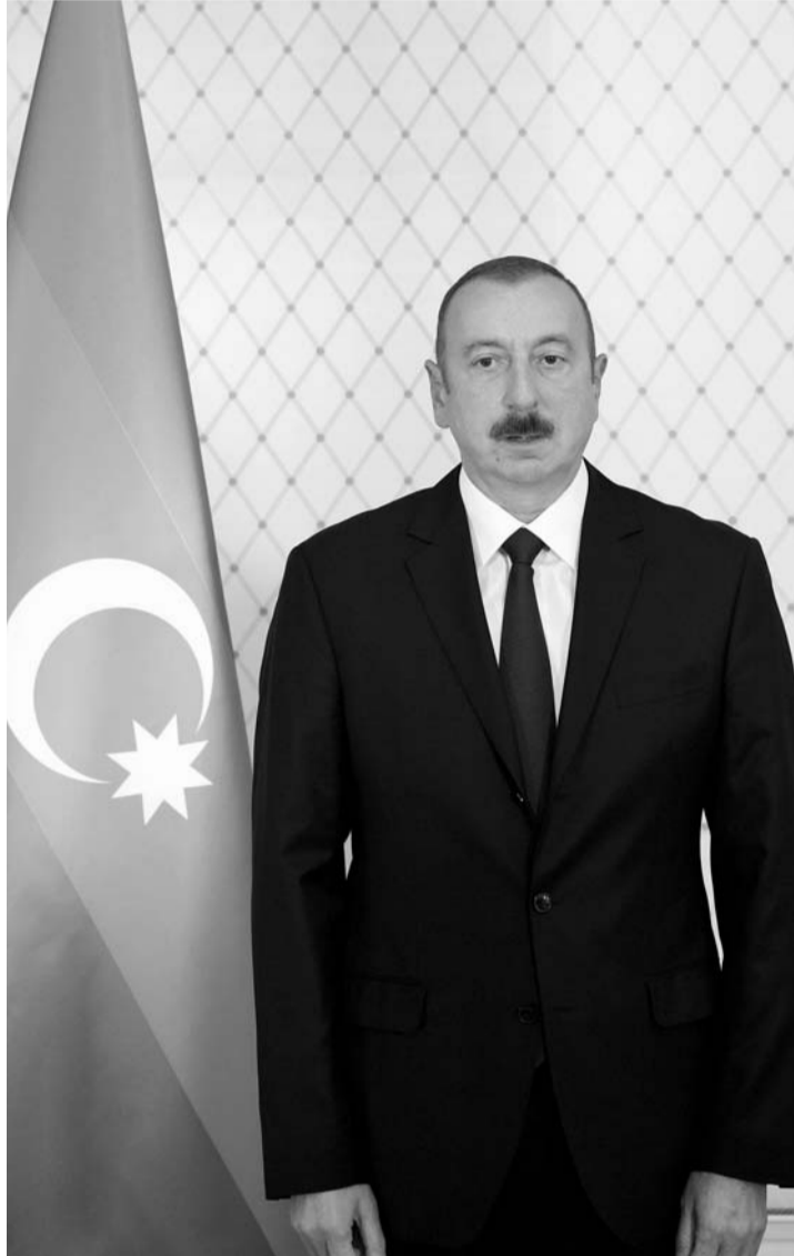
peyki və "Azerspace 2".

Qeyd edək ki, bu münasibətlə Azərbaycan Respublikasının Prezidenti Cənab İlham Əliyev də xalqa təbrik ünvanlayıb və bildirib ki, bu gün ölkəmizin həyatında çox əlamətdar bir gündür. "Bu gün "Azerspace 2" peykimiz orbitə çıxarıldı" deyərək bildirən ölkə başçımız bu münasibətlə bütün Azərbaycan xalqını ürkədən təbrik edib və vurğulayıb ki, bu, ölkəmizin növbəti qələbəsidir, dövlətimizin növbəti uğurudur: "Son beş il ərzində Azərbaycan orbitə 3 peyk çıxara bilmişdir. Azərbaycan bu gün dünyanın kosmik klubunun üzvüdür və dünyanın kosmik sənayesində öz mövqələrini möhkəmləndirir. Peyklərin orbitə çıxarılması dövlətimizin gücünü göstərir, bizim siyasətimizi göstərir. Bizim artıq 3 peykimiz var: "Azerspace 1" telekommunikasiya peyki, "Azersky" müşahidə