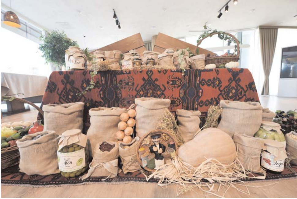
Əvvəli Səh. 2