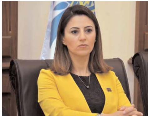
SEVİNC FƏTƏLİYEVA, Milli Məclisin deputatı

Bu gün ölkəmizin qarşısında duran əsas vəzifələr uğurla icra edilir, təhlükəsizlik yüksək səviyyədə qorunur, ictimai-siyasi sabitlik möhkəmlənir. Demokratik cəmiyyət quruculuğu, dünya birliyinə inteqrasiya sahəsində ciddi nailiyyətlərə imza atan Azərbaycan dünya ölkələri ilə münasibətlərini suverenliyə və ərazi bütövlüyünə hörmət, sərhədlərin toxunulmazlığı və daxili işlərə qarışmamaq kimi beynəlxalq norma və prinsiplər əsasında qurmaqla, beynəlxalq birliyin etimadını qazanıb. Azərbaycanın dünyadakı nüfuzu, bir çox beynəlxalq layihələrin reallaşması bu münasibətlərin daha da dərinləşməsinə səbəb olub.