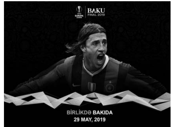
BİRLİKDƏ BAKIDA 29 MAY, 2019

E.Krespo İtaliyanın “Parma” klubunun heyətində UEFA Kubokunun 1998-1999-cu il mövsümünün qalibi olub. Onun adı 2004-cü ildə FIFA-nın 100 illik yubileyi münasibətilə Pele tərəfindən tərtib edilmiş yaşayan 125 ən yaxşı futbolçunun siyahısında yer alıb. Ötən il sentyabrın 20-də UEFA İcraiyyə Komitəsi 2019-cu ildə futbol üzrə UEFA Avropa Liqasının final oyununun Bakı Olimpiya Stadionunda (BOS) keçirilməsi haqqında qərar qəbul edib.