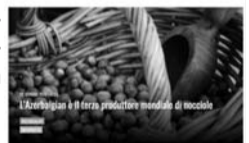
Azərbaycan - 3 illik fındıq istehsalatının dünyada üçüncü ən böyük ölkəsidir. (Alimentando.info)

Qeyd edək ki, ölkəmizdə 10 milli park fəaliyyət göstərir. Milli parkları ziyarət etmək istəyənlər nazirliyin rəsmi internet saytının "xidmətlər" bölməsinə daxil olub onlayn şəkildə bilet ala bilərlər. Bununla yanaşı, milli parkların giriş məntəqələrindən də bilet əldə etmək mümkündür.