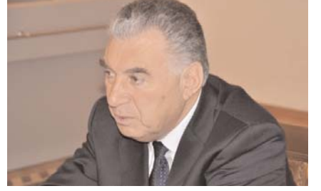
Əli Həsənov, Azərbaycan Respublikası Baş nazirinin müavini, Yeni Azərbaycan Partiyasının sədr müavini

Azərbaycan günü-gündən sosial-iqtisadi baxımdan inkişaf etdikcə, beynəlxalq nüfuzunu artırıdıcqca, dünya birliyindəki mövqelərini gücləndirdikcə uğurlarımızı görmək istəməyənlər ortaya çıxır və hər fürsətdə ölkəmizi, xalqımızı gözdən salmağa çalışırlar. Xüsusilə bəzi xarici dairələr və təşkilatlar ölkəmizdəki reallıqları təhrif etmək, beynəlxalq aləmdə yanlış rəy formalaşdırmaq cəhdlərini davam etdirirlər. Bu cür məkrli əməllərin hansı mənbədən qaynaqlandığı məlumdur: erməni lobbisi və bütövlükdə antiAzərbaycançı şəbəkə Azərbaycanın dövlət müstəqilliyinin bərpası edildiyi ilk gündən ölkəmizə qarşı “qara piar” aparmaqla məşğuldurlar. ABŞ-dakı “Freedom House” beynəlxalq hüquq-müdafiə təşkilatının 2019-cu il hesabatında Azərbaycanın Cənubi Qafqazda yeganə “azad olmayan” ölkə kimi qiymətləndirməsi gülünc səslənməklə yanaşı bu təşkilatın qeyri-obyektiv və bilinməyən metodologiya ilə qiymətləndirmə aparən çirkin qurum olmasının bir sübutüdür.