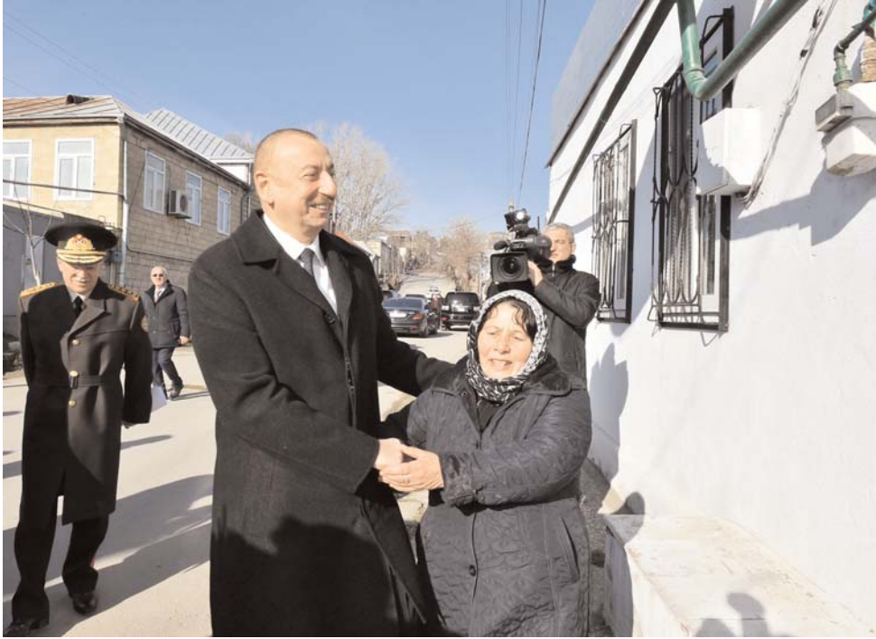
Əvvəli Səh. 2